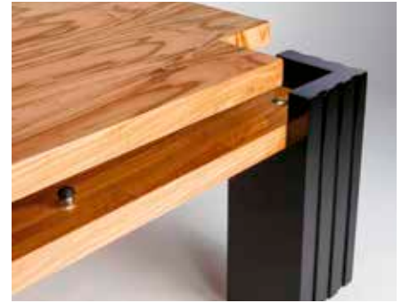
▲ Rogoz setzt in der Tat zwischen den Böden auf eine Mixtur aus An- und Entkopplung.

Jede der drei Ebenen des Rogoz Audio Stand ist mit rund 80 Kilogramm