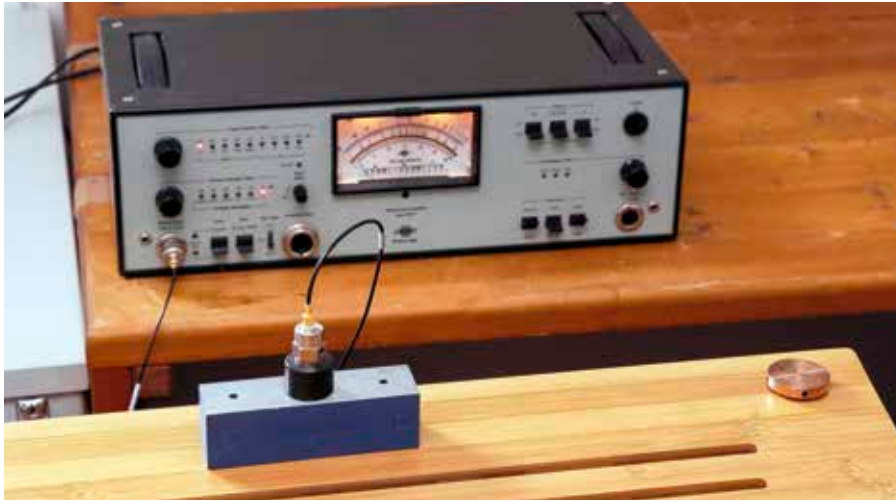
▲ Die breitbandig angeregten Racks wurden alle mit einem Brüel & Kjær-Beschleunigungsaufnehmer und definiertem Sweep auf der Top-Ebene gemessen, einmal pur und mit drei (!) Plattenspielern.

Nur im Einzelfall ließen Messergebnisse und Hörversuche einen Zusammenhang erkennen, Gesetzmäßigkeiten gibt es kaum.